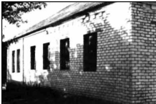
Єврейська синагога в м. Славута.