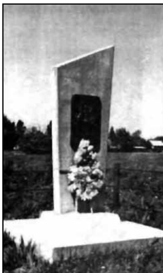
Пам'ятний знак на місці розстрілів євреїв Берездівського гетто на території єврейського кладовища.

Взято: Ковальчук С., Фрідман А. Назв. праця. – С. 67.