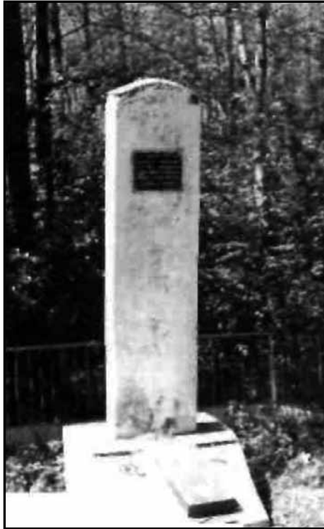
Пам'ятник на братській могилі євреїв села Красностав у лісі під селом Гута.