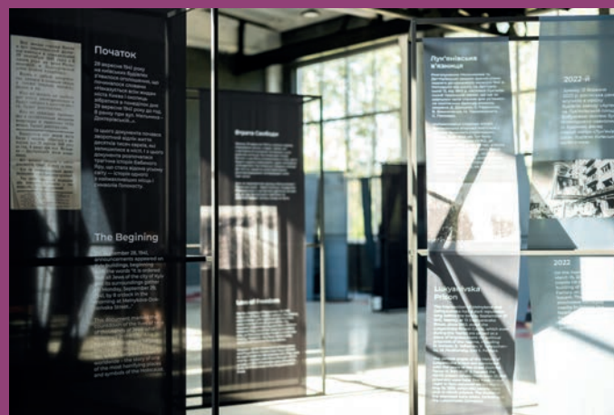
Виставка «Бабин Яр: Дзеркала смерті».