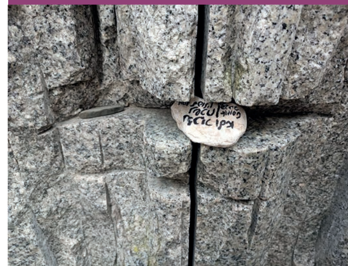
Фрагмент Меморіалу в Белжеці.